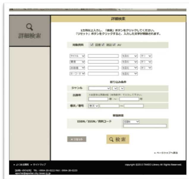
図 3 武雄市図書館 OPAC

もしくは検索の Q&A を用意しておくべきではないだろうか。また、「不正」という文言では、利用者を不快にさせかねない。例えば「検索条件に誤りがあります。もう一度やり直してください。」とするべきではないだろうか。