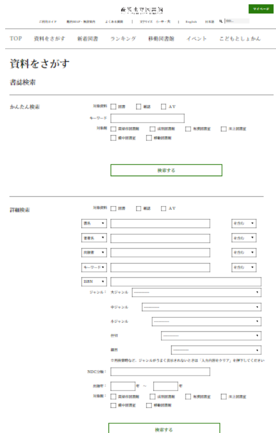
図 1 高梁市立図書館の OPAC 画面

実際の運営状況は不明であるが、通常、資料の状況(書架にあり、貸出中、予約件数など)を、常に OPAC に反映する必要がある。